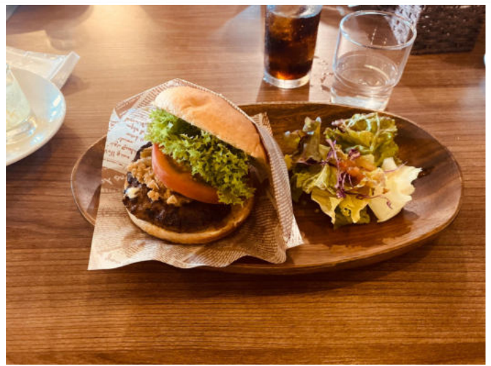
↑ the crankの修善寺バーガー

長々と私の自己紹介とさせていただきますが、本題に入りたいと思います。 私が先日チームメイトと共に伊豆をサイクリングしたので皆様も私の情報を元に 伊豆をサイクリングしてみてもは？？