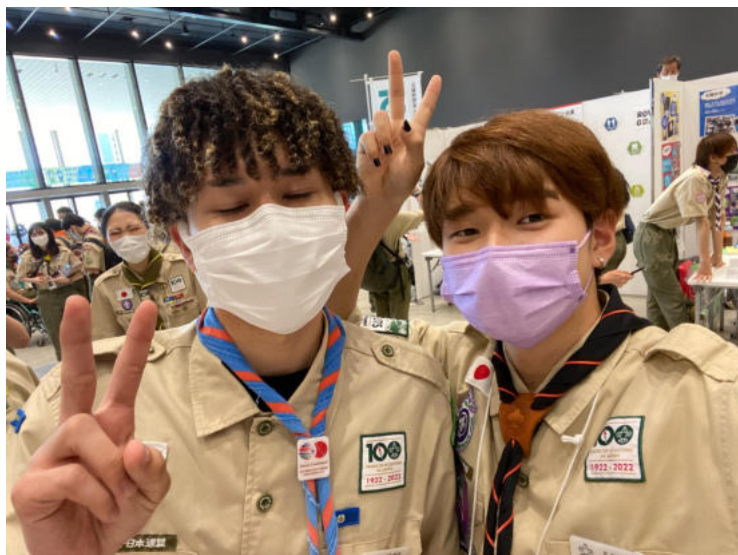
↑福岡県連盟の先輩（左）と私（右）

かくいう私自身も仲の良い横浜のスカウトに影響を受け2年ほど前からロードバイクにハマってしまい、そのまま仲の良い横浜のスカウトが参加していた、レーシングチームに入り、レースまで出る様になりました。（結構ロードバイク乗ってるスカウト多い！）