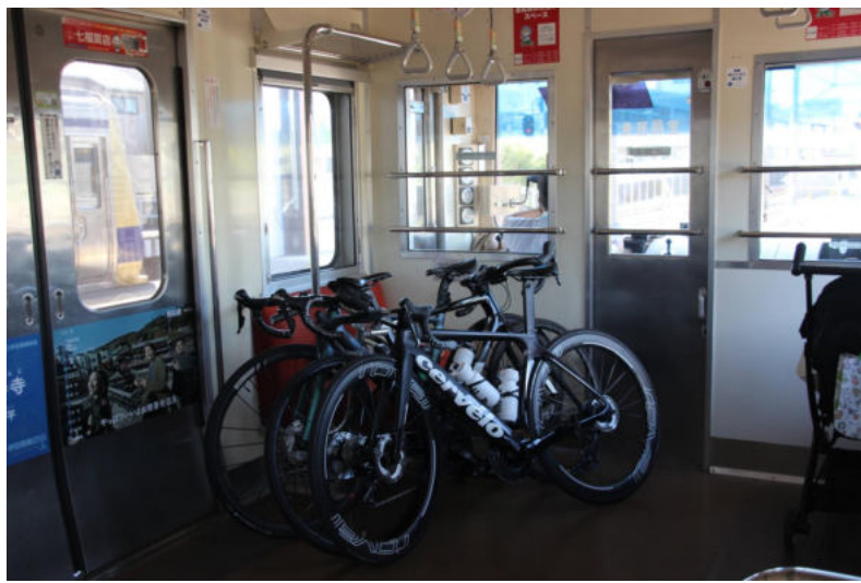
↑ 伊豆箱根鉄道サイクルトレイン